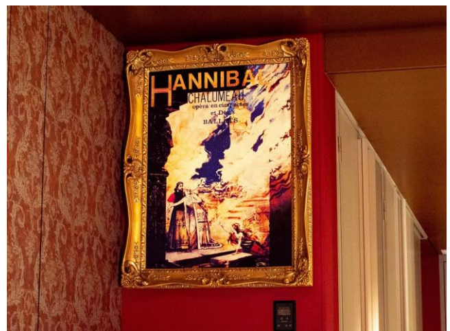
劇中劇「ハンニバル」の額入りポスター