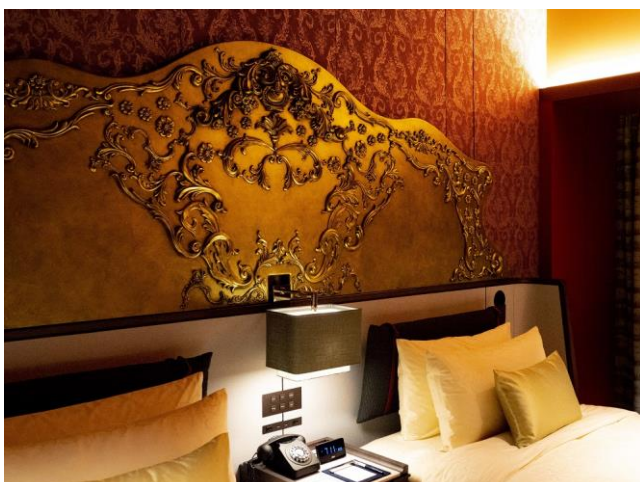
舞台装飾から着想を得たデザインのヘッドボード