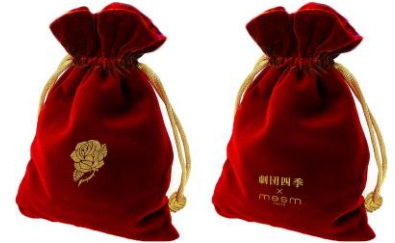
アメニティポーチ(非売品)