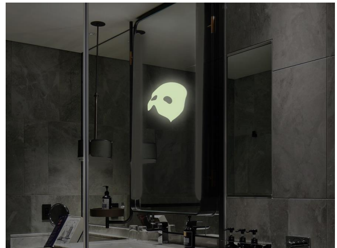
暗闇の中鏡に浮かび上がる怪人の仮面