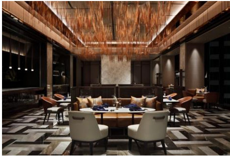
レストラン「シェフズ・シアター」