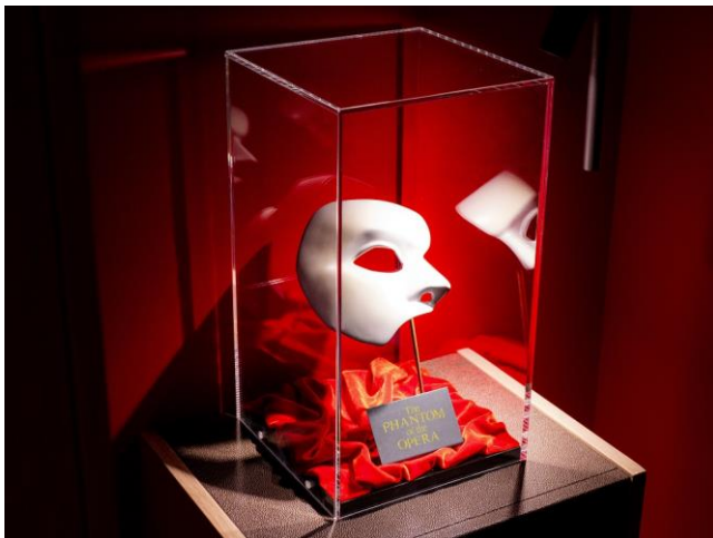
怪人の仮面(レプリカ)