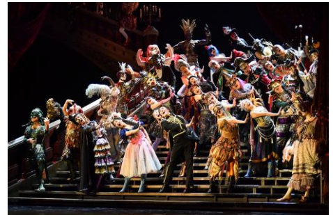
『オペラ座の怪人』

JR 東日本四季劇場[秋]のこけら落としを飾った『オペラ座の怪人』は、フランスの作家ガストン・ルルーの同名小説を基にしたミュージカルです。パリ・オペラ座の地下に棲み、歌姫クリスティヌに恋をする“怪人”。その彼の悲しいまでの愛の様が、“21 世紀のモーツァルト”アンドリュウ・ロイド＝ウェバー(『キャッツ』、『エビータ』他)の流麗で重厚な旋律によって紡がれます。1986 年ロンドン開幕以来、世界中で上演されており、四季においても 1988 年東京初演以来、総入場者数は 730 万人以上、総上演回数 7000 回以上を誇る、まさに国内屈指のミュージカル作品です。