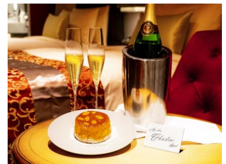
ウェルカムスイーツ&スパークリングワイン