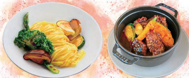
Braised Beef Cheeks in Red Wine with Tagliatelle