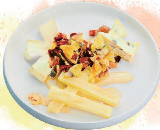
Cheese Platter with Dried Fruits and Nuts