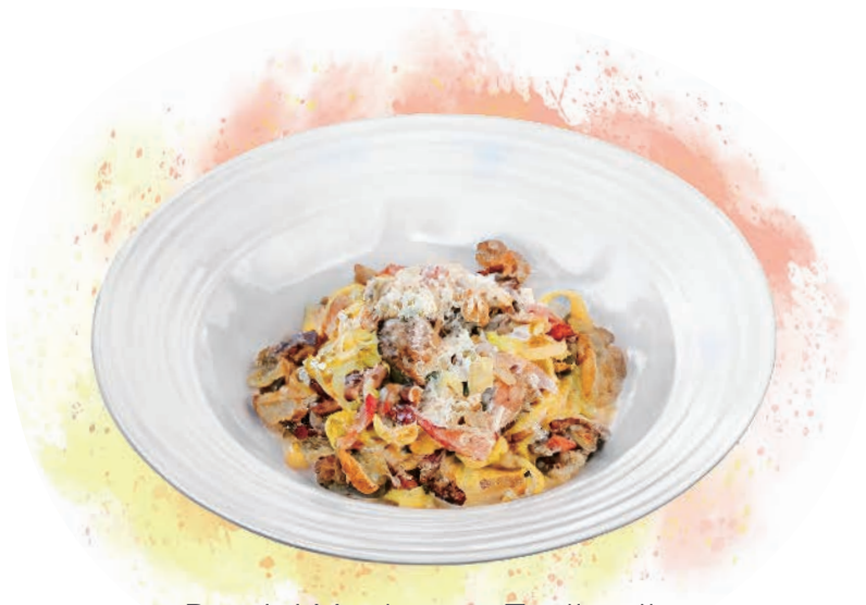
Porcini Mushroom Tagliatelle