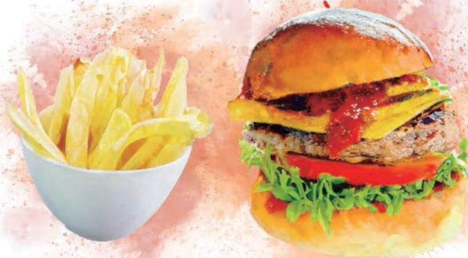
Classic Beef Burger with French Fries