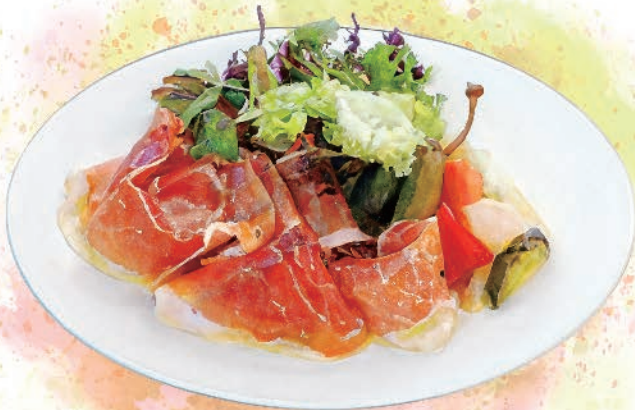
Jamon Serrano with Pickled Seasonal Vegetables