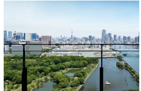
ガーデンビュー(バルコニー付き客室からの眺め)

スターサービスセンター Tel: 03-5777-1111 / Email: reservation@mesm.jp