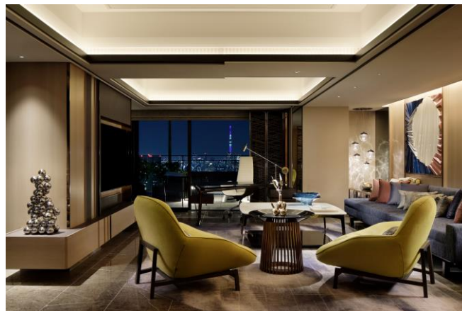
チャプター4 스위트 リュクス (ピアノレッスン場所)