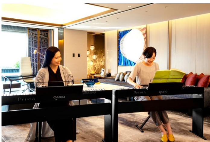
スイートルームでのレッスンイメージ