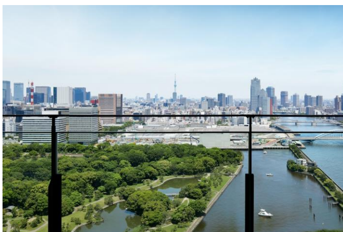
チャプター4 バルコニーからの眺め