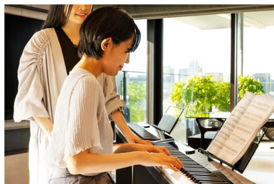
スイートルームでのレッスンイメージ

■ご宿泊に関するお問い合わせ：電話 03-5777-1111 (代表) / メール reservation@mesm.jp