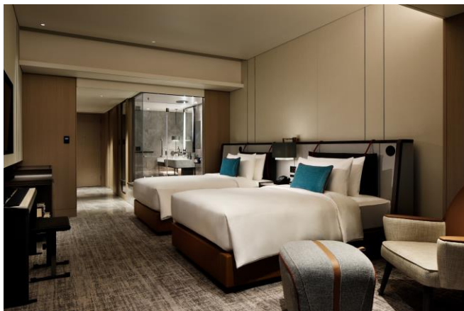
チャプター1 ツイン (ご宿泊部屋)

・Bluetooth® ワードマークおよびロゴは、Bluetooth SIG, Inc.が所有する登録商標であり、カシオ計算機株式会社はこれらのマークをライセンスに基づいて使用しています。